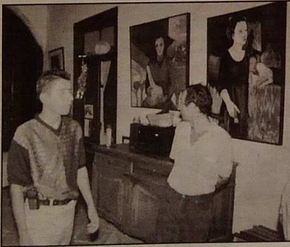
Şölen çerçevesinde düzenlenen sergi de büyük ilgi topluyor

Lefkoşa'daki Arabahmet Mahallesi'nin tarihi ve kültürel dokularını koruyup gelecek nesillere aktarılmasına katkıda bulunmak, mekanlarını korumak ve yeniden yaşanabilir hale getirmek amacıyla geleneksel olarak düzenlenen “Arabahmet Yaşiyor Şöleni”nin 2.'si önceki akşam başladı.