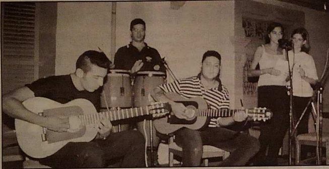
Arabahmet Yaşiyor Şöleni'nde önceki akşam verilen konser büyük beğeni topladı