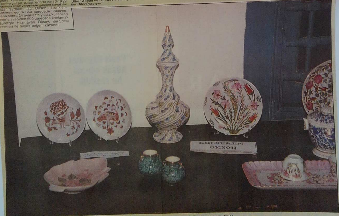
Porselen önce 850 derecede pişirilip, 24 ayar altın yaldız kullanıldıktan sonra 600 derecede tekrar pişirilip piyasaya sürülüyor.