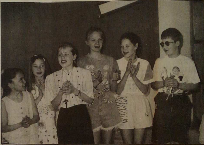
Ev sahibi öğrencilerle birlikte derse katılan sevimli konuklarımızın söylemiş oldukları çeşitli şarkılar oldukça güzeldi.

Milli Eğitim ve Kültür Bakanlığı ile Has- Der tarafından organize edilen, 1. Uluslararası Çocuk ve Barış Festivali etkinlikleri coşkulu bir şekilde devam ediyor.