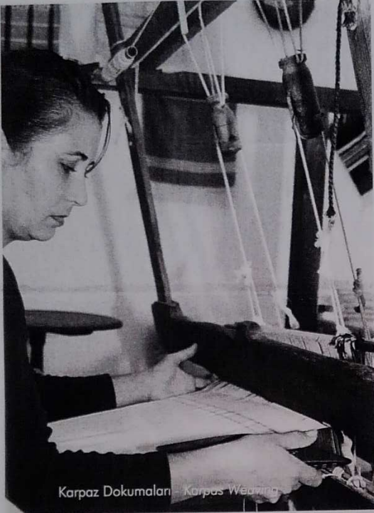
Karpaz Dokumaları - Karpas Weaving