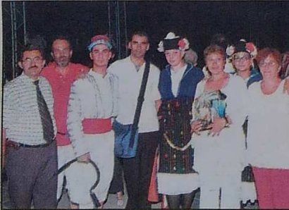
Yunanistan-İskeçe ekibine ekibimizin hediye takdim etmesi memnurlukla karşılandı ve hatıra resmi alındı

Ödül töreni sonrası ekipler Almanya'dan gelen folk grubunun konserini izledi. Festival süresince ekipler Kepez, İntepe, Kumkale ve