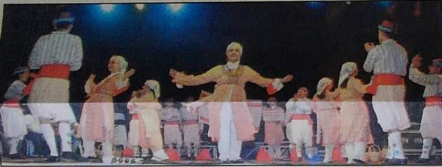
Cumhuriyet Meydanı'ndaki gösteriler muhteşemdi