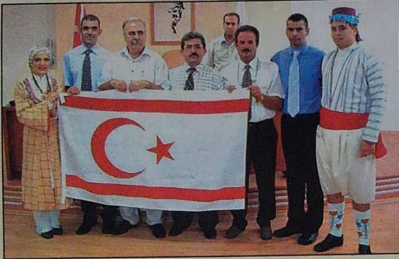
Belediye Başkanı Ülgür Gökhan ekibimize hatıra resmi çekti

Çanakkale Belediyesi tarafından düzenlenen 42'nci Troia Festivali'ne katılan Büyükkonuk Belediyesi Halk Dansları ekibi yurda döndü