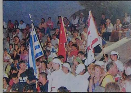
TC-KKTC ve Yunan bayraklarının törenlerdeki birlikteliği güzel bir tablo oluşturdu